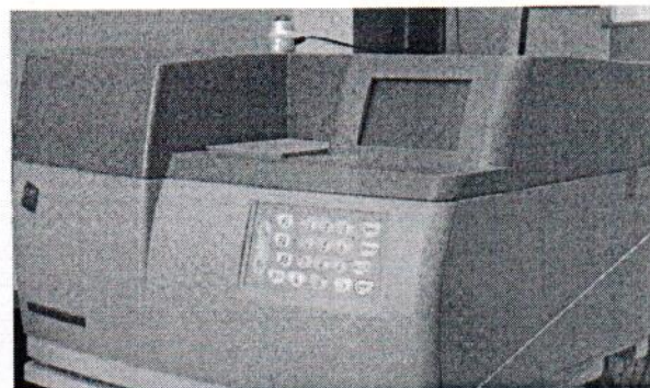
Рисунок 2 - Места пломбирования анализатора СПЕКТРОСКАН MSW